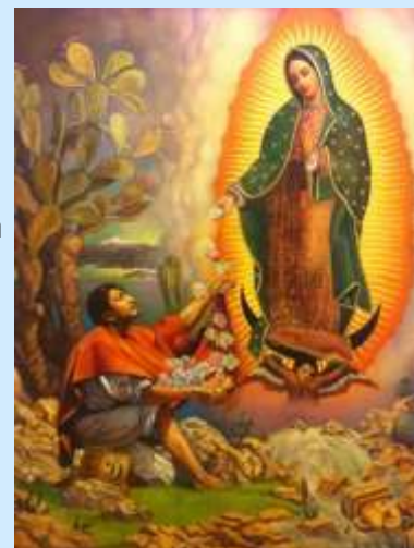
Artist's rendering of the apparition in 1531.

There are many marvelous aspects to this apparition of the Blessed Virgin Mary that I would like to highlight. Next week I will give an explanation of some of the symbolism contained in the image of Our Lady of Guadalupe.