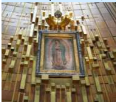
The actual tilma which hangs in the Basilica in Mexico City.

The feast day of Our Lady of Guadalupe – declared patroness of the Americas by Pope Pius XII in 1945 – is December 12 each year. This was the date of the final apparition of Our Lady to Juan Diego (pictured at right), the humble Aztec, at Tepeyac in Mexico City in 1531 at which she left the famous miraculous image on his tilma – the apron-like garment he wore. Juan Diego's actual tilma image of Mary (pictured at left) continues to be on display at the Basilica of Our Lady of Guadalupe in Mexico City which is the most visited Catholic pilgrimage site in the world.