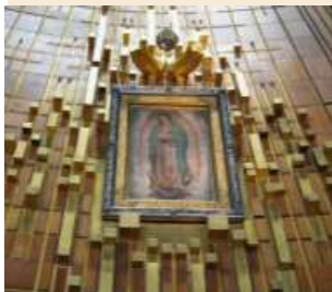
The actual tilma which hangs in the Basilica in Mexico City.

El día de la fiesta de Nuestra Señora de Guadalupe – declarada patrona de las Américas por el Papa Pío XII en 1945 – es diciembre 12. Esta fue la fecha de la última aparición de la Virgen a Juan Diego (en la imagen a la derecha), el humilde Azteca, en el Tepeyac en la Ciudad de México en 1531 en la que dejó la famosa imagen milagrosa en su tilma. La imagen actual de la Virgen María en la tilma de Juan Diego (en la foto a la izquierda) sigue en exhibición en la Basílica de Nuestra Señora de Guadalupe en la Ciudad de México, que es el lugar de peregrinación católica más visitado del mundo.