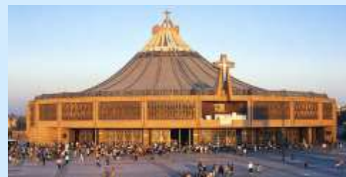
The Basilica of Our Lady of Guadalupe in Mexico City

Miraculous Image: The image was "imposed" onto Juan Diego's tilma – a porous and coarse cactus material similar to burlap. The normal life expectancy of this garment was 10 or 20 years under normal conditions; however, the image of Our Lady of Guadalupe has survived for 484 years! This is even more amazing considering that the image was not placed under protective glass until 1647 – 116 years after the apparition. So, during all those previous years it was left exposed to the elements in a hot and humid environment plus years of smoke from candles, oil lamps and incense – not to mention the thousands of people who touched it with their hands or other objects. In 1921, a bomb was detonated on an altar under the image by anti-Catholic forces. In that blast even though a cast-iron cross next to the image was twisted out of shape and the marble altar rail was heavily damaged, the tilma was unharmed! To this day the image remains intact, undamaged and the colors are still vivid.